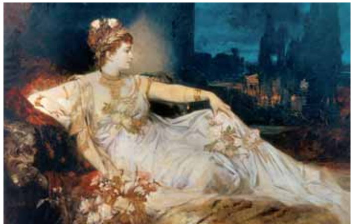
Ausstellungsort: Wien Museum im Künstlerhaus, Karlsplatz 5, 1010 Wien Ausstellungsdauer: 9. Juni bis 16. Oktober 2011 Öffnungszeiten: Täglich 10 bis 18 Uhr, Donnerstag bis 21 Uhr

erlangte? Die Ausstellung fragt nach den Gründen für Makarts außerordentliche Popularität und versucht diese als europäisches Zeitphänomen einzuordnen. Im Werk und in der Selbstinszenierung Makarts werden bereits moderne Phänomene wie das Massenevent und der Starkult sichtbar.