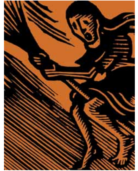
Abbildung: Holzschnitt „Neusonntagskinder“, Franz Traunfellner